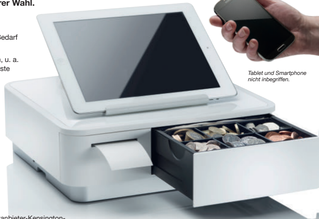
Tablet und Smartphone nicht inbegriffen.

Unter www.mPOP.com finden Sie Informationen zur neuesten Software für mobile POS-Systeme, Einzelhandel und Gastronomie, die Ihre Anforderungen erfüllt und mit dem mPOP von Star funktioniert. Nutzen Sie alle Vorteile mobiler POS-Systeme, wie günstigere Hardware und Software, die in der Cloud und offline funktioniert, damit Sie überall Zugriff auf Ihr Unternehmen haben, ganz wie Sie es wünschen!