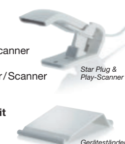
Star Plug & Play-Scanner