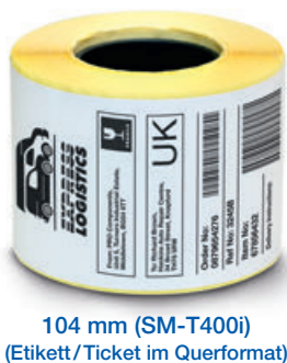
104 mm (SM-T400i) (Etikett/Ticket im Querformat)

Für weitere Informationen über das Erstellen von Etiketten mit unseren mobilen Druckern kontaktieren Sie Star bitte per E-Mail an support@star-emea.com