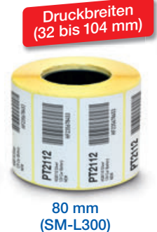
80 mm (SM-L300)