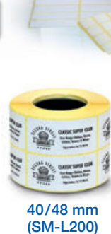
40/48 mm (SM-L200)

Kompakte, leichte Drucker für viele Etikettieranforderungen: